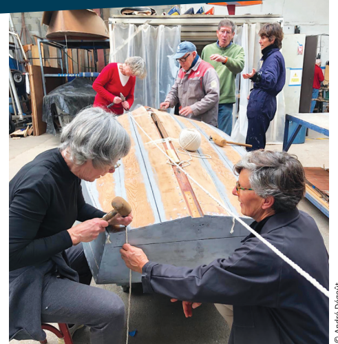
Le Bulot en restauration

Ces dériveurs ont, pour certains, remporté des médailles olympiques et bien d'autres régates. Parfois, ils naviguent dans le Vieux Port et l'avant-port pour le plaisir des badauds qui, sur les quais, les admirent tant ils ont de la classe. Les Rochelais pourront les voir de près lors des Fêtes maritimes qui se préparent pour la fin du mois dans les bassins de la ville.